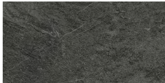
MR5V Quarzite20 Black 50x100