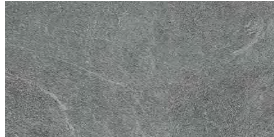
MR5W Quarzite20 Platinum 50x100