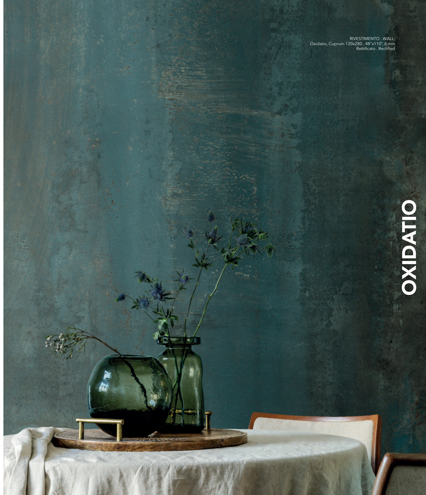
RIVESTIMENTO . WALL: Oxidatio, Cuprum 120x280 . 48"x110", 6 mm Rettificato . Rectified