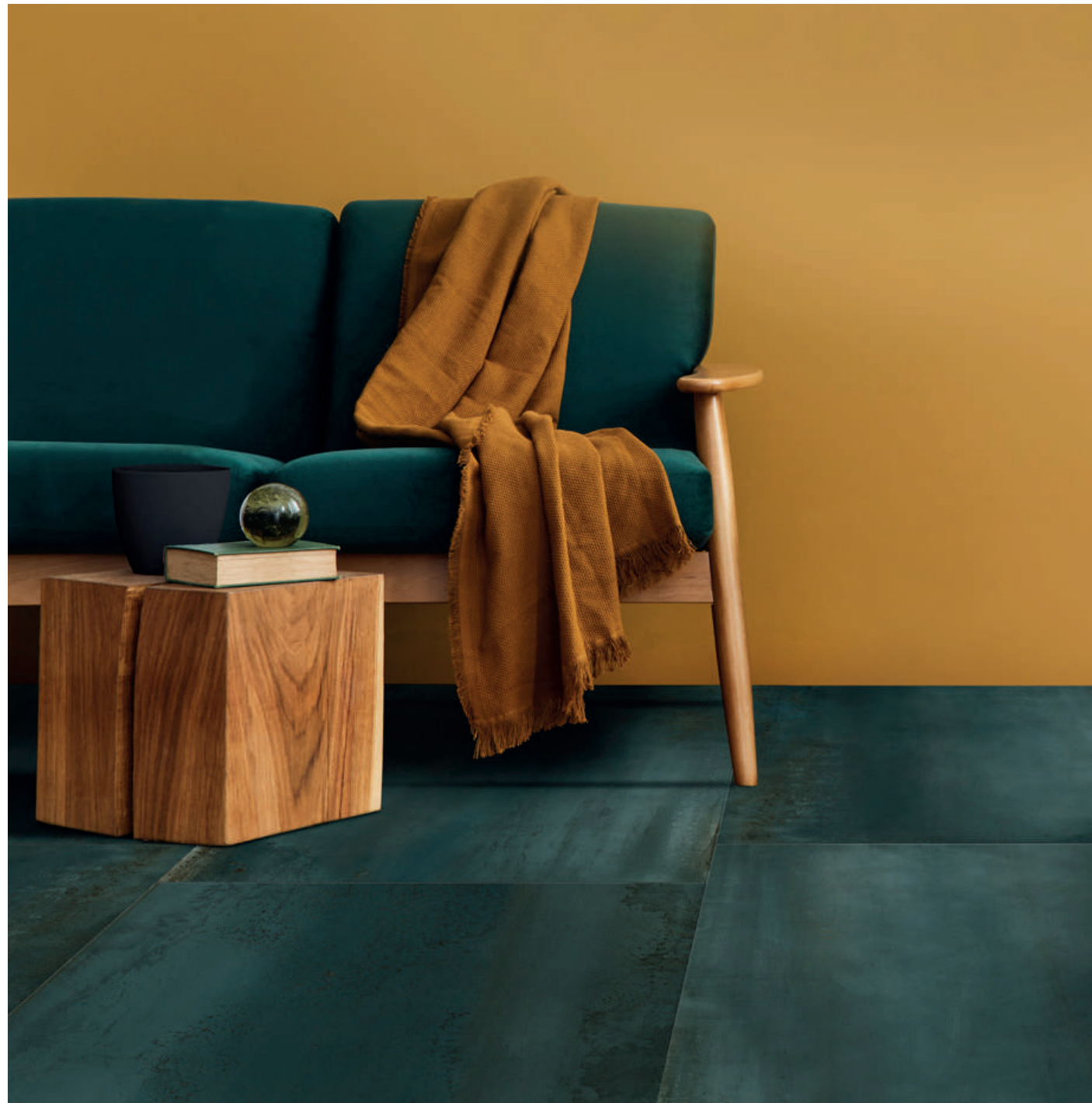
PAVIMENTO . FLOOR: Oxidatio, Cuprum 60x120 . 24"x48", 9 mm Rettificato . Rectified